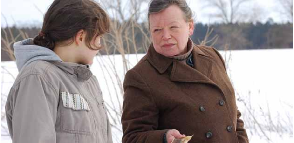
WINTERTOCHTER

es heißt, aus Figuren heraus zu erzählen. Wie die Macher über die Figuren zu einem modernen Look und einer stimmigen, heutigen Adaption gefunden haben, ist schon inspirierend. Und die Einführung von Sherlock Holmes und Dr. Watson als ungleiches Team, deren charakterliche Unterschiede sie füreinander zur perfekten Hälfte machen, ist in der ersten Folge sehr gut gebaut.